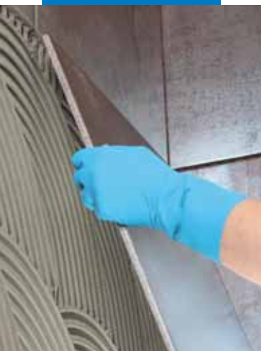
Posa di piastrelle in ceramica di grosso formato a parete

permettere di evitare lo scivolamento delle piastrelle posate a parete anche se di grande formato.