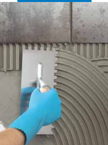
Stesura di Ultralite S1 con spatola dentata a parete