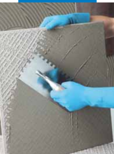
Stesura dell'adesivo sul retro