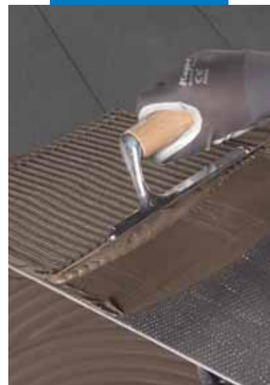
Applicazione dell'adesivo sul retro della piastrella