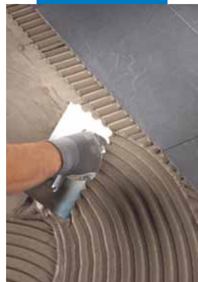
Stesura dell'adesivo a pavimento con spatola con dente arrotondato di raggio pari a 9 mm