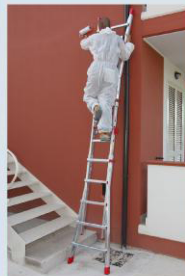
La scala in uso esteso