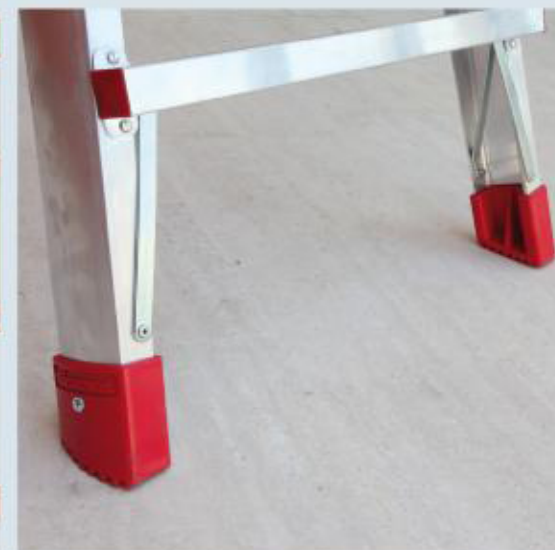
Nuovo tappo e rinforzo di base con profilo arrotondato